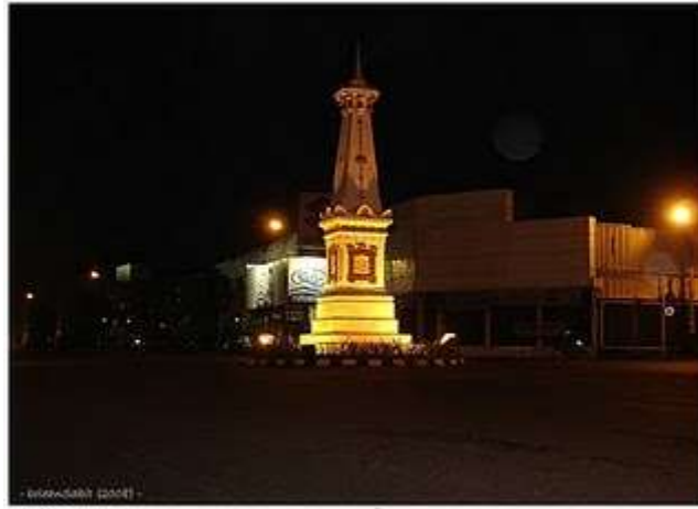
Gambar 3.1 Tugu Jogja Istimewa